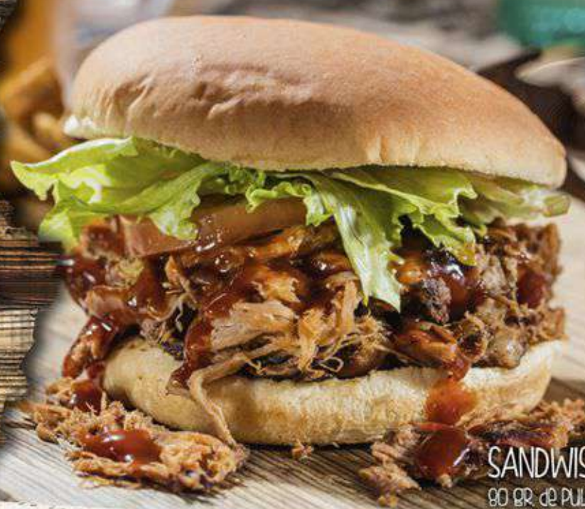
SANDWICH JR. 85 80 GR. de PULLED PORK Y PAPAS