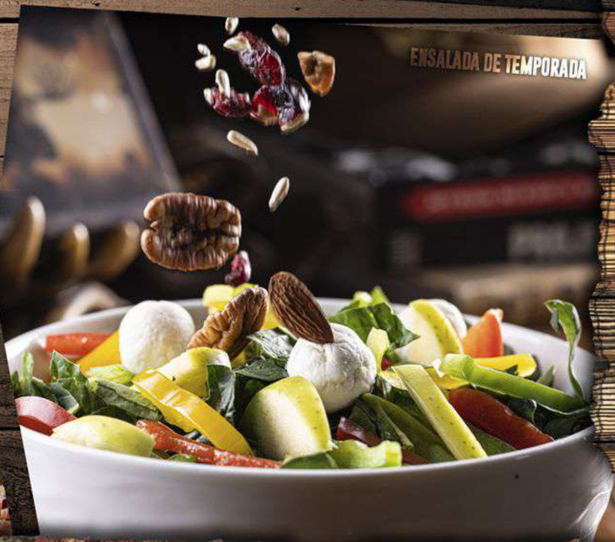
ENSALADA DE TEMPORADA