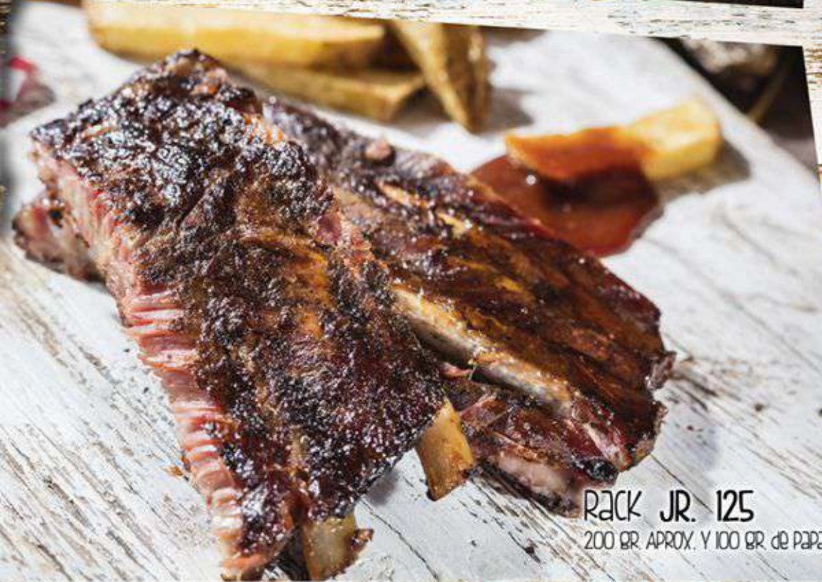
RACK JR. 125 200 GR. APROX. Y 100 GR. de PAPAS