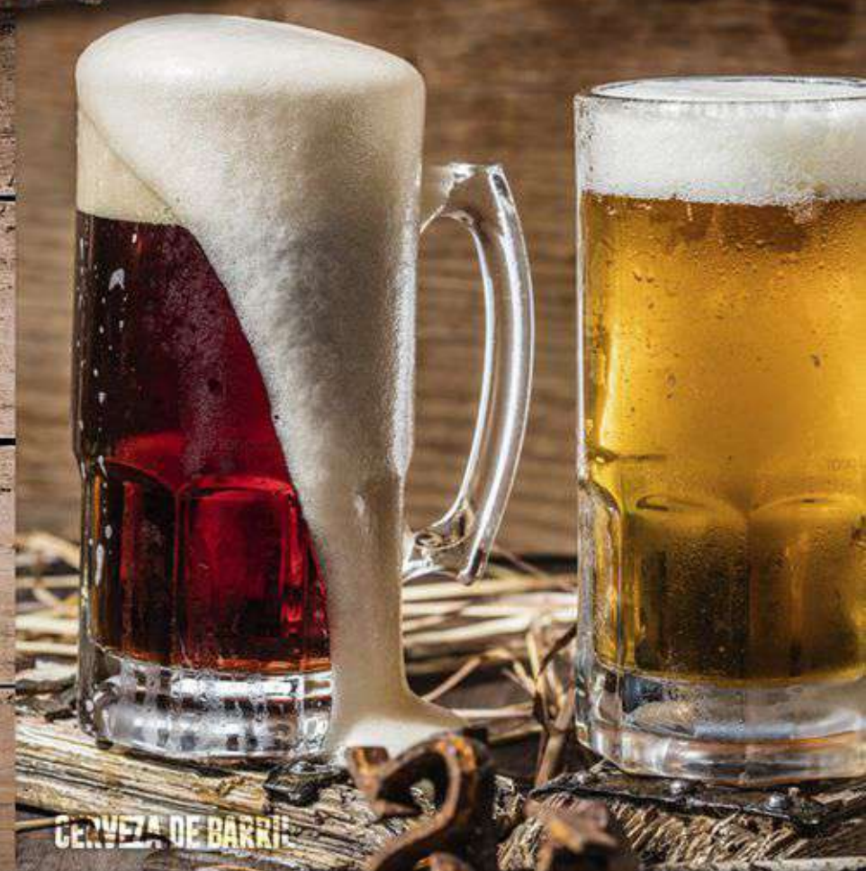
CERVEZA DE BARRIL