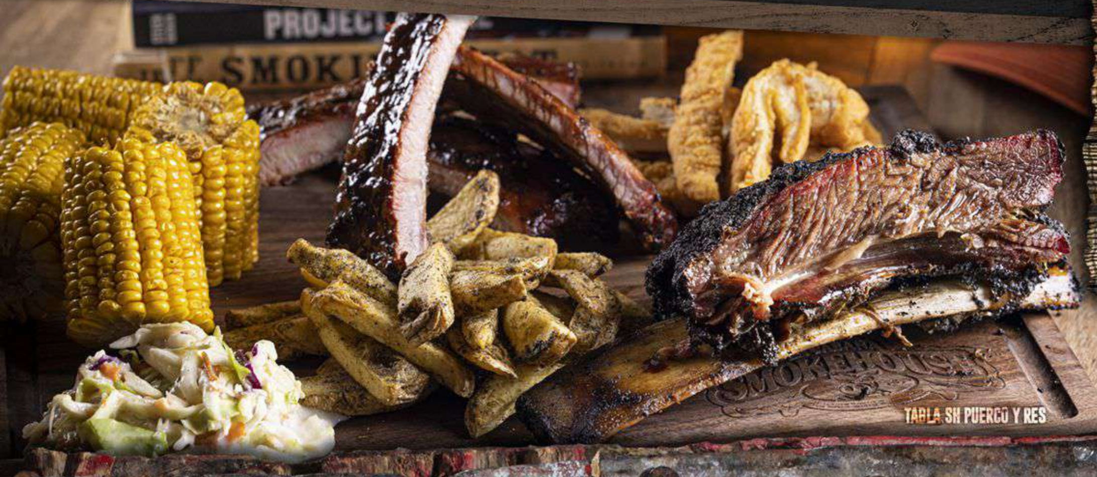
TABLA SH PUERCO Y RES

DELICIOSO COMBO DE ALGUNAS DE NUESTRAS ESPECIALIDADES: 15 KG DE COSTILLA, 6 PZA ELOTES, 2 SALCHICHAS POLACAS, 2 COUNTRY CHICKEN, 500 GRS DE PULLED PORK, 600 GRS DE PAPAS, 60 GRS DE PEPIÑILLOS, 320 GRS DE ENSALADA DE COL, 10 TORTILLAS. ( PARA 8 PERSONAS )