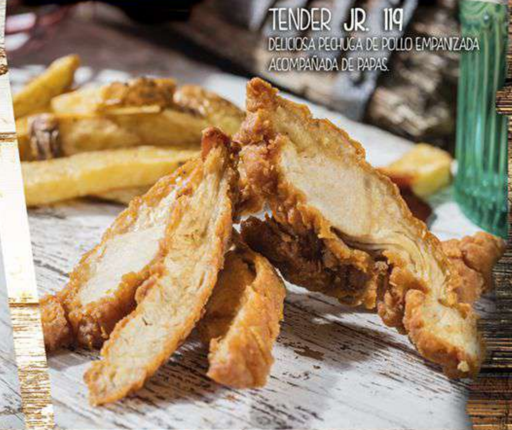
TENDER JR. 119 DELICIOSA PECHUGA DE POLLO EMPANZADA ACOMPANADA DE PAPAS.