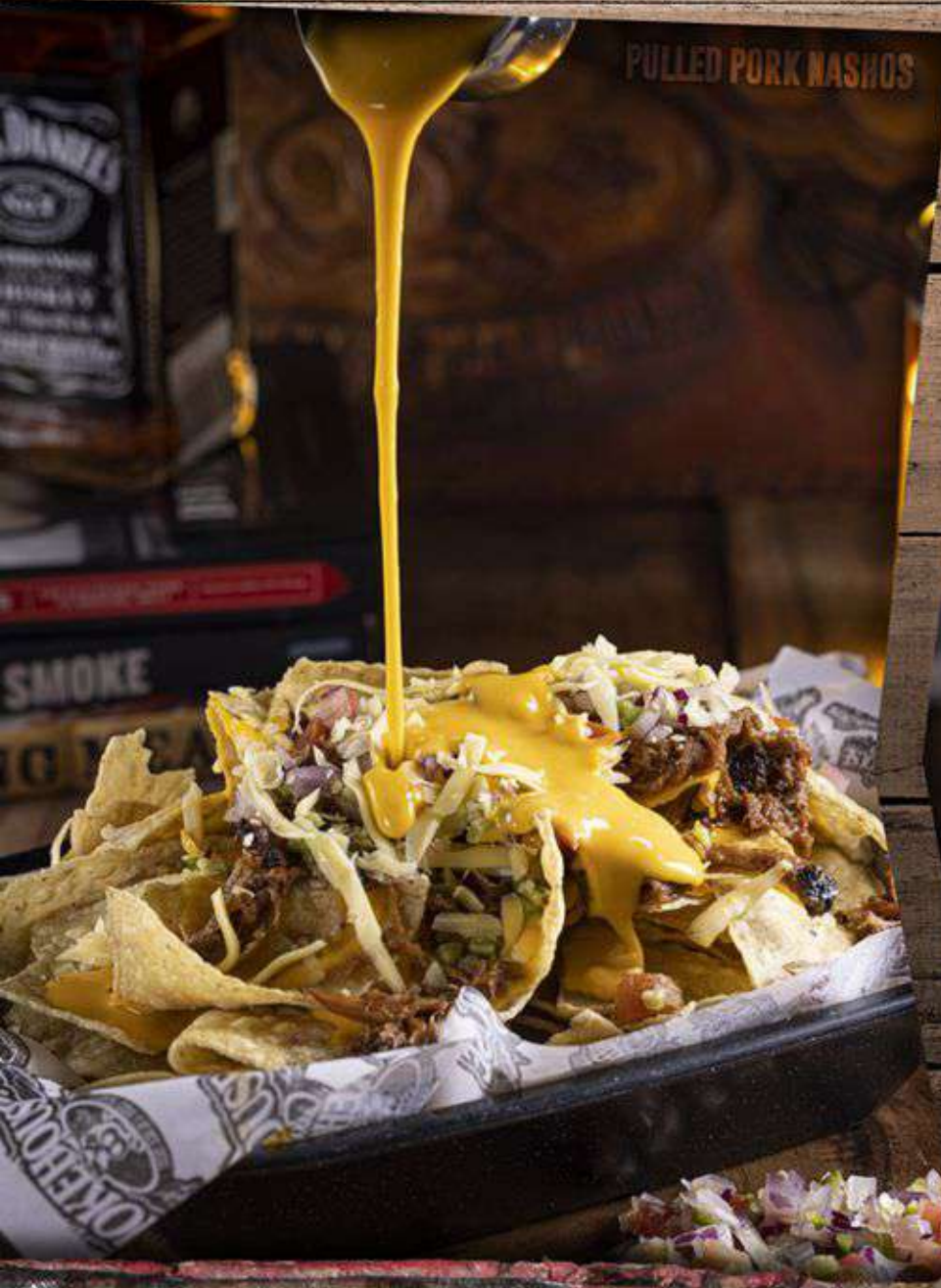
PULLED PORK NASHOS

DELICIOSA ENSALADA DE TEMPORADA, CON UNA BASE DE ESPINACAS Y FRESCO TOQUE DE PIMIENTOS, FRUTOS SECOS, MANZANA Y QUESO DE CABRA